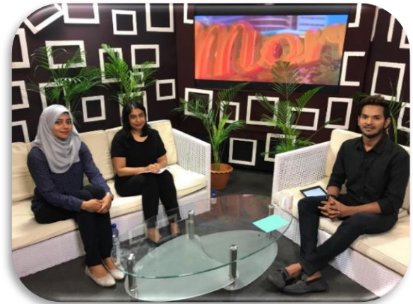
موجة في اسيوط - اذاعة اسيوط في برنامجها في اذاعة اسيوط في برنامجها