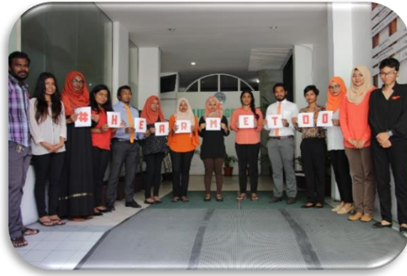
ٽرانسپارنٽ سوسائٽي ۽ ٻين سوسائٽي گروپن جي ڪاروبارن ۽ ڪاروبارن 16 ڏينهن جي ڪاروبارن ۽ ڪاروبارن