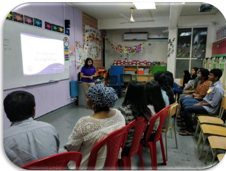
پیشہ ورانہ تعلیم کے شعبہ کے سربراہ نے نئی نصابی کتابوں کی پیشکش کی۔