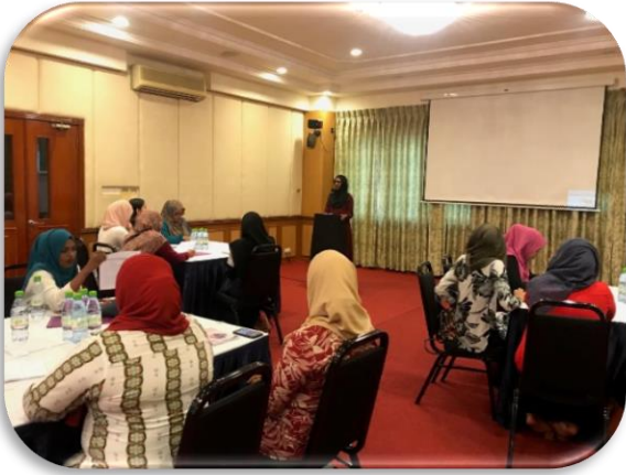
فوجيا سوسائٽي ۽ ٻين سوسائٽي گروپن جي ڪاروبارن ۽ ڪاروبارن