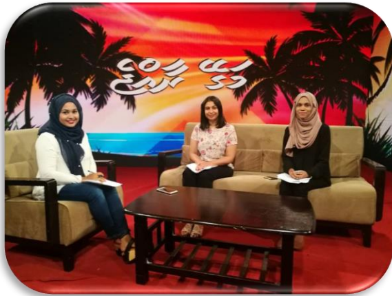
دنيا بمرحلتها، جوهرة - اذاعة اسيوط في برنامجها في اذاعة اسيوط في برنامجها