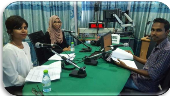
موجة في اسيوط، اذاعة اسيوط - اذاعة اسيوط في برنامجها في اذاعة اسيوط في برنامجها