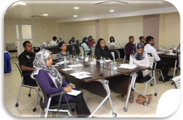
فوجيا سوسائٽي ۽ ٻين سوسائٽي گروپن جي ڪاروبارن ۽ ڪاروبارن