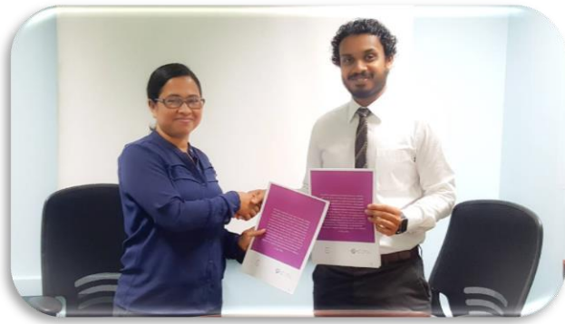
پیشہ ورانہ تعلیم کے شعبہ کے سربراہ نے نئی نصابی کتابوں کی پیشکش کی۔